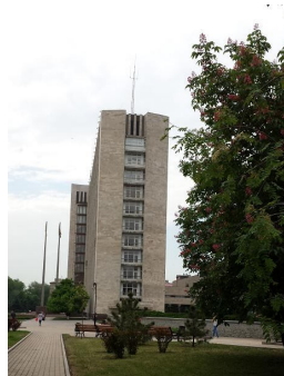
Besök på det regionala ungdomsparlamentet